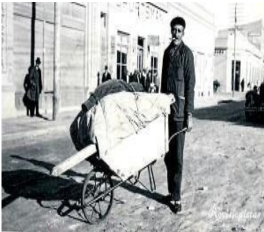
EL VASCO DE LA CARRETILLA

“Yo de chico iba seguido allá, ni bien terminaban las clases me tomaba el vaporcito, había dos vapores que iban y que ya desaparecieron, no están más, uno Iguazú y el otro ciudad de Corrientes. Iban hasta Puerto Iguazú desde el Puerto de Buenos Aires; era como un barco lechero que paraba en cada puerto, carga y descarga, eran cargueros pero que llevaban algunos pasajeros, entre ellos viajábamos nosotros”.